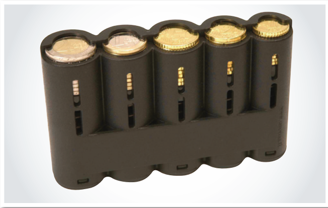
359-2001 Euro-raharenki, värit: musta ja sininen