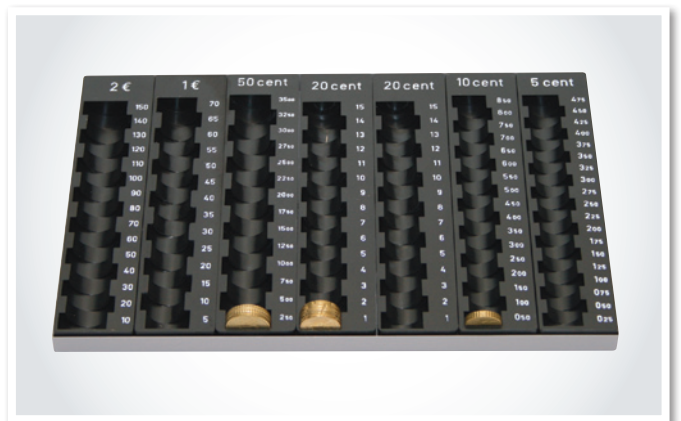
359-2020 Kolikkolauta + sarakkeet